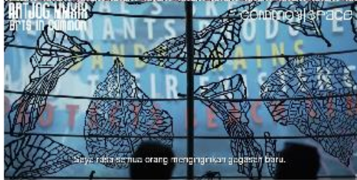
Gambar 5. Instalasi seni Andrita Yuniza Orbandi di entrance ArtJog 2019 "Arts in Common"

daun jati yang diletakkan ke dasar laut dianggap sebagai kontribusi besar pada kehidupan di bumi, yakni sebagai penghasil oksigen (Gambar 5).