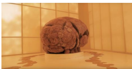
Gambar 9. Instalasi seni di entrance Art Jog 2022 “Expanding Awareness”

Instalasi seni utama entrance ArtJog 2022 sebagai akhir dari seri tema “ Arts in Common ” dengan sub-tema “ Expanding Awareness ” memaknai tentang ruang, waktu, dan kesadaran sebagai upaya perluasan kesadaran yang merefleksikan realitas masa kini, masa depan, serta harapan (Gambar 9). Makna tersebut berawal mula dari suatu proses persiapan yang kebersamaan penggerak inklusivitas yang menghadirkan karya interaktif, terinspirasi dari wujud kepedulian dengan sesama manusia.