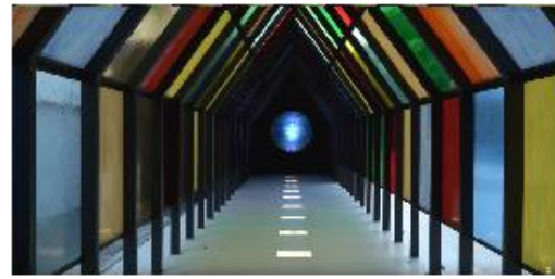
Gambar 7. Instalasi Seni Heri Pamad di entrance Art Jog 2021 “Time (to) Wonder”

mengungkapkan ekspresinya melalui media baru.