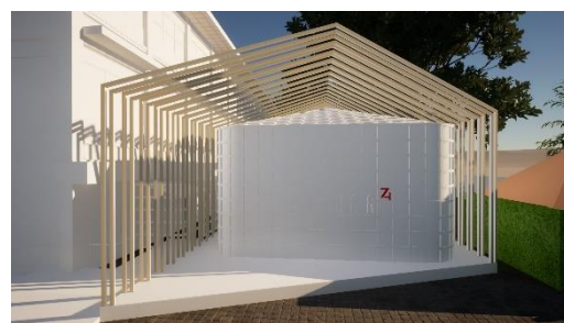
Gambar 6. Visualisasi instalasi seni entrance ArtJog 2019

Instalasi seni entrance ArtJog 2019 yang bertema "Arts in Common" dibentuk dengan selubung berbahan besi berwarna putih yang terlihat garis kaku memiliki 3 titik sumbu yang berhubungan (Gambar 6). Garis tersebut tersusun secara berulang dan memiliki sudut mengerucut pada bagian atas instalasi seni. Satu kesatuan dari bentuk tersebut, di dalamnya terdapat suatu bentuk gubahan massa berwarna putih yang memiliki aksan fasad bergaris bersilangan, dengan posisi gubahan massa tidak simetris dan garis sumbu selubung instalasi seni. Pada bagian depan instalasi seni ArtJog 2019 terdapat interaksi pengunjung yang berfoto secara individu maupun berkelompok. Hal tersebut mendefinisikan bahwa karya ini menjadi background foto ketika pengunjung melakukan interaksi foto di depan karya dan individu karya ini menjadi objek foto dengan background JNM dengan pemahaman bahwa hal ini adalah suatu kesempatan yang tidak terulang yaitu merasakan JNM dengan karya instalasi seni ArtJog 2019.