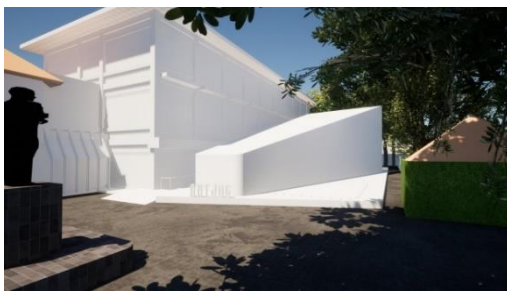
Gambar 10. Visualisasi instalasi seni di entrance Art Jog 2022 “Expanding Awareness”

Hasil pengamatan pada instalasi seni entrance ArtJog tahun 2022 kembali dapat dirasakan seperti tahun-tahun sebelum Covid-19 dengan gemuruhnya pengunjung yang berkelompok maupun individu. Sangat terlihat kedamaian dan kebahagiaan setelah berakhirnya Covid-19 di tahun 2021. Bentuk ruang instalasi seni utama entrance 2022 memiliki bentuk radial yang menambah elemen terpisah dari bangunan Galeri JNM. Secara horizontal memiliki bentuk site lokasi jajar genjang dan bentuk instalasi seni entrance berupa persegi sudut tumpul yang tidak sempurna, seakan-akan terpotong sebagian oleh bangunan Galeri JNM (Gambar 10).