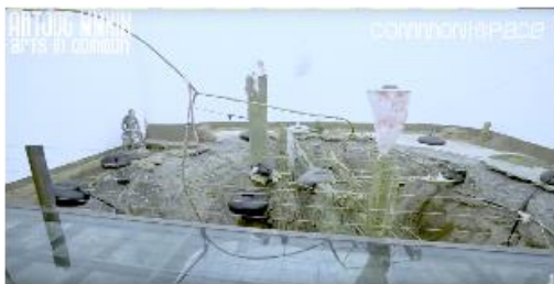
Gambar 3. Instalasi seni Handiwirman Saputra di entrance ArtJog 2019 "Arts in Common"

dalam instalasi seni dengan penggambaran pembangunan properti dan tata kota.