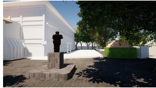
Gambar 2. Visualisasi Galeri JNM

Berdasarkan pengamatan, secara keseluruhan bangunan di JNM memiliki fasad dinding dan bekas jendela yang sebagian ditutup dengan partisi sebagai selubung bangunan dengan kolom sebagai pembatas ruangan secara vertikal. Selain itu, juga memiliki balok dan shading sebagai pembatas lantai secara horizontal (Gambar 2).