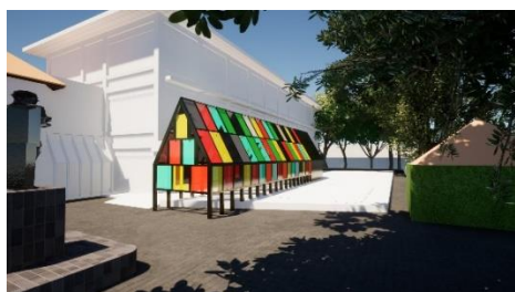
Gambar 8. Visualisasi instalasi seni di entrance Art Jog 2021 “Time (to) Wonder”

meskipun dengan posisi berdiri. Namun dengan posisi duduk di halaman dan fokus dengan pandangan ke arah instalasi ini, maka akan terlihat bahwa terdapat celah di bagian bawah yang tidak tertutup kaca berwarna. Hal ini menunjukkan bahwa untuk melihat instalasi ini diperlukan usaha menyesuaikan jarak.