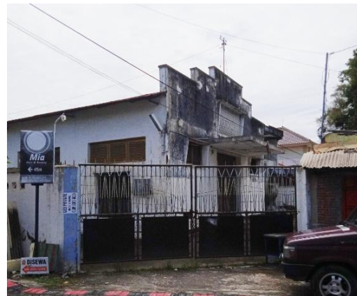
Gambar 5. Gudang penyimpanan di Semarang Barat

Data terkait bangunan gudang diperoleh dari data komunitas. Gudang memiliki atap pelana dengan dinding gewel yang melenceng dari gaya Jengki. Gewel tidak mengikuti bentuk atap, melainkan menggunakan bentuk stepped gewel (dinding segitiga bertingkat di ujung atap) yang identik dengan arsitektur kolonial. Ciri khas gaya Jengki tampak pada bentuk jendela miring yang menjorok keluar (kantilever) serta keberadaan ventilasi pada bagian dinding gewel. Beranda beratap datar dan dibuat tanpa tiang penyangga. Kombinasi dari bahan pelapis yang sering digunakan tidak ditemukan pada bangunan ini. Dinding bercat putih dikombinasikan dengan bahan kayu dan beton. Desain gudang merupakan perpaduan antara gaya Jengki dan kolonial. Karakter geometris dan asimetris khas Jengki hanya tampak pada sebagian elemen, menghasilkan tampilan yang cenderung minimalis.