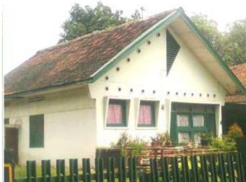
Gambar 4. Asrama Yonif 400/Reider, Kecamatan Banyumanik