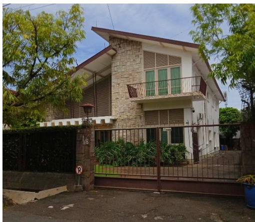
Gambar 2. Rumah tinggal di Jalan Supeno, Semarang Kota

Rumah ini memiliki atap pelana terbelah khas Arsitektur Jengki dengan krepak di tengahnya sebagai aliran udara. Dinding miring hanya ditemukan di balkon lantai dua sehingga bentuk dasar bangunan terlihat kubus dari luar, dinding bergeser hanya di bagian tengah membentuk beranda. Loster geometri diganti dengan krepak yang terpasang miring mengikuti atap. Jendela miring masih ditemukan pada sisi samping rumah. Atap beranda yang berdiri sendiri membentuk gelombang, terbuat dari beton. Kombinasi kubistis batu serit yang dominan, penggunaan pagar besi, jendela kaca, elemen kayu dan beton menyatu membuat kesan minimalis sehingga rumah ini terkesan tidak neko-neko.