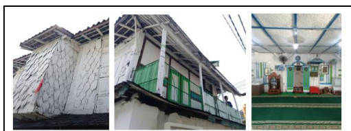
Gambar 3. Langgar Dukuh Kayu sebagai salah satu objek yang paling disukai partisipan

“Yang menarik dari langgar tua tidak hanya tampilan bangunannya, tapi juga ada barang bersejarah di dalamnya”.