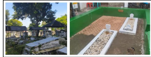
Gambar 5. Kondisi Komplek Makam Belanda Peneleh (kiri) dan makam leluhur di kampung (kanan)

dijelaskan sejarahnya”. Dengan demikian, penanda dan kemudahan akses menuju objek amatan menjadi perhatian utama untuk memperbaiki kualitas walking tour .