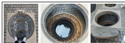
Gambar 7. Visual Sumur Jobong yang kurang disukai partisipan

Objek lain yang masuk dalam kategori tidak disukai responden adalah Sumur Jobong. Partisipan pada dasarnya mengapresiasi keberadaan objek ini sebagai salah satu peninggalan sejarah penting di Kota Surabaya, namun visual Sumur Jobong dinilai kurang menarik. Partisipan menyebut "Jika dilihat dari jauh, sumur terlihat seperti lubang manhole saluran biasa" . Tampilan ini sebetulnya bagian dari strategi promosi walking tour Pokdarwis, dimana akses Sumur Jobong dibuka hanya untuk peserta walking tour . Hal tersebut dapat menjadi pertimbangan bagi Pokdarwis selaku pengelola walking tour .