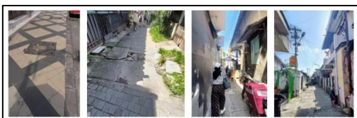
Gambar 6. Kondisi pedestrian way dan gang perkampungan Peneleh

Selain objek-objek yang diapresiasi dengan baik oleh partisipan, terdapat juga beberapa objek yang tidak disukai. Melihat kolase foto yang diambil partisipan, objek yang masuk dalam klasifikasi tidak disukai ini merupakan objek yang dirasa kurang memberikan performa yang memuaskan partisipan. Karena kegiatan walking tour ini menitikberatkan kegiatan jalan kaki, kondisi jalan yang kurang baik menjadi perhatian utama partisipan, seperti "Jalannya kurang oke dan kurang bersih di bagian awal" . Kebersihan juga menjadi aspek yang banyak tidak disukai oleh partisipan. Salah satu partisipan menyatakan bahwa "Rute melewati gang yang sempit dan kurang bersih" . Partisipan juga merasa bahwa rute melalui gang-gang sempit dapat mengganggu kenyamanan dan privasi penduduk sekitar. Salah satu respon dari partisipan "Jalur yang sempit dan memotong bisa saja mengganggu rumah warga" .