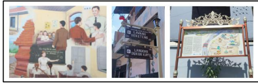
Gambar 4. Mural dan penanda kawasan sebagai representasi objek yang dirasa berguna oleh partisipan