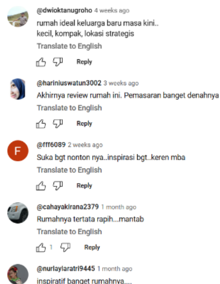
Gambar 2. Kolom komentar Kanal YouTube Ulasan Rumah

rumah, fungsi dari setiap ruang, diiringi dengan penyampaian material-material yang digunakan pada setiap sudut rumah, serta akses rumah juga disampaikan dalam video, bagian ketiga yang menjadi akhir bagian dari video membahas terkait dengan anggaran yang digunakan untuk membangun atau merenovasi rumah. Pembahasan terkait material cukup detail sehingga dapat dijadikan inspirasi oleh penonton video ulasan tersebut. Pembahasan tentang anggaran tidak dibahas secara terperinci, melainkan hanya dibahas total pengeluarannya. Beberapa video yang diunggah menunjukkan ruang penyimpanan yang dikamufase oleh pemilik rumah dan area-area yang dibuat agak tersembunyi oleh pengguna. Hal ini dapat dijadikan inspirasi oleh masyarakat yang sedang membangun rumahnya. Beberapa komentar yang ditinggalkan penonton seperti pada Gambar 2 menunjukkan respon positif dari konten ulasan rumah yang disebar di YouTube.