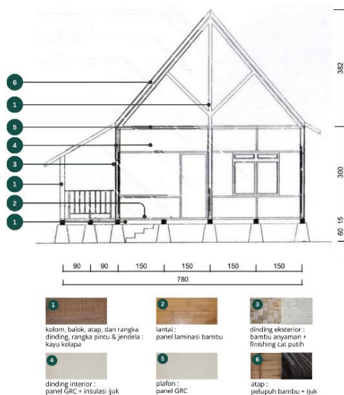
Gambar 7. Material Kampung Layung Cottage

Material struktur, penutup atap, dan dinding luar menggunakan material alami seperti kayu, bambu, dan ijuk. Semua bagian cottage yang terlihat dari luar menggunakan material alami yang dibuat secara handmade oleh para pekerja atau dalam kata lain bukan material buatan pabrik. Material permukaan interior seperti penutup lantai, dinding, dan plafon menggunakan material yang sifatnya buatan pabrik seperti lantai laminasi bambu, papan GRC dan keramik (Gambar 7). Selanjutnya, material dari Kampung Layung Cottage akan dibahas satu persatu dengan pembahasan yang akan mengarah kepada kriteria pemilihan material hijau.