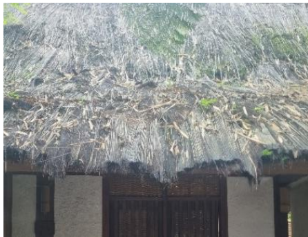
Gambar 11. Material ijuk

sekitar 0,24 – 1MJ/kg (Hammond & Jones, 2011).