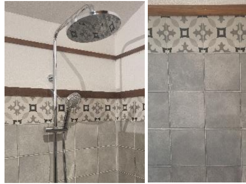
Gambar 12. Material keramik

Keramik digunakan hanya pada dinding area kamar mandi (Gambar 12). Pabrik keramik berada di daerah Tangerang, radius sekitar 140 km dari Dusun Bambu. Keramik bukan material alami. Energi embodied keramik sekitar 12 MJ/kg (Hammond & Jones, 2011). Keramik merupakan material yang bahan utamanya berasal dari tanah liat. Tanah liat bukan material yang dapat diperbarui dalam waktu singkat, tetapi sumbernya melimpah. Energi embodied keramik tinggi karena proses produksinya melibatkan tahap yang mengonsumsi energi dalam jumlah besar, terutama saat pembakaran.