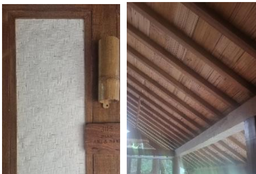
Gambar 9. Material bambu pada dinding dan atap

yang artinya berada dalam radius 170 km dari Dusun Bambu. Bambu termasuk material dengan energi embodied rendah. Bambu adalah salah satu tanaman dengan pertumbuhan tercepat, dengan siklus panen yang relatif singkat, yaitu sekitar 3 hingga 5 tahun. Bambu merupakan material yang terbarukan, material alami, dan tidak mengandung unsur berbahaya. Energi embodied untuk bambu sekitar 0,5-2 MJ/kg (Hammond & Jones, 2011).