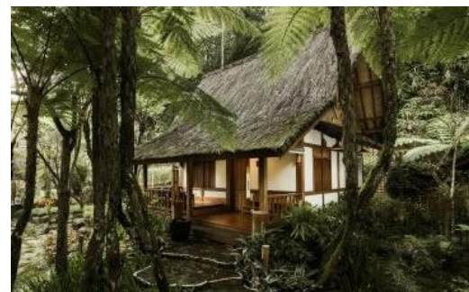
Gambar 3. Eksterior Kampung Layung Cottage

Kampung Layung Cottage merupakan akomodasi penginapan di kawasan ekowisata Dusun Bambu yang berlokasi di Jalan Kolonel Masturi Km. 11, Cisarua, Kabupaten Bandung Barat (Gambar 3). Perancangan Dusun Bambu sudah dimulai dari tahun 2009 oleh arsitek Oky Kusprianto bersama Studio APTA, yang kemudian mulai dibuka untuk umum pada tahun 2014.