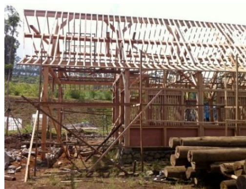
Gambar 8. Material kayu kelapa

material alami dan endemik Jawa Barat. Kayu kelapa didapat dari daerah Jawa Barat, berada dalam radius sekitar \pm 170 km dari lokasi cottage . Berdasarkan laporan “Embodied Carbon: The Inventory of Carbon and Energy (ICE)” yang disusun Geoffrey Hammond dan diterbitkan oleh Building Services Research and Information Association (BSRIA), rata-rata energi embodied kayu sekitar 5,38 MJ/kg. Angka tersebut merupakan energi embodied dari produksi material, tidak termasuk transportasi dari material ke lokasi proyek. Kayu adalah bahan alami yang bersifat sirkular karena berasal dari sumber daya terbarukan dan bisa tumbuh kembali. Kayu juga tidak beracun dan dapat terurai secara alami, sehingga dapat kembali menjadi bagian dari alam meskipun prosesnya memakan waktu cukup lama (Aggestam & Giurca, 2022).