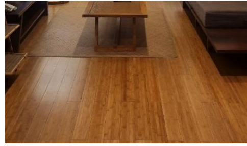
Gambar 10. Material bambu laminasi

Bambu laminasi digunakan untuk material penutup lantai (Gambar 10). Berbeda dengan bambu yang dipakai di dinding dan atap, bambu laminasi merupakan bambu yang sudah melalui beberapa proses di pabrik. Bambu laminasi dibuat dengan memotong batang bambu alami menjadi bilah-bilah tipis, kemudian diawetkan, direkatkan dengan perekat khusus, dan dipres hingga membentuk lembaran atau papan yang solid. Meskipun energi embodied nya lebih tinggi dari bambu yang digunakan untuk dinding dan atap, energi embodied bambu laminasi tetap lebih rendah dibandingkan dengan material hasil pabrik yang berbahan baku material nonalami. Energi embodied untuk bambu laminasi sekitar 5 MJ/kg (Sharma, dkk., 2015).