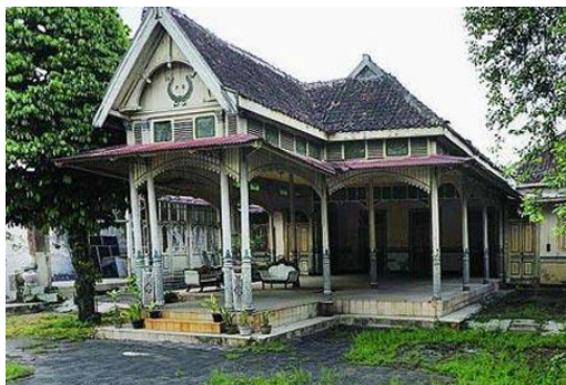
Gambar 4. Fenomena Hibrid Arsitektur Rumah Tinggal Saudagar Tembakau di Kudus dan Rumah Kalang Jogja