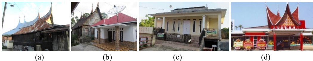
Gambar 2. Beberapa proses transformatif yang dialami Arsitektur Vernakular Minangkabau

Deleuze dikonsepsikan sebagai virtuality , sebuah kondisi kuantum yang mencerminkan potensi perubahan dan inovasi di masa depan.