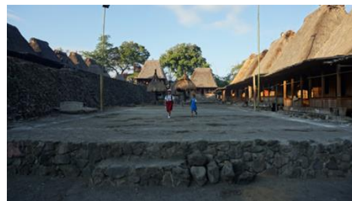
Gambar 3. Arsitektur Ngadha di awal abad 20 (atas) dan di abad 21 (bawah)