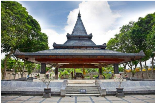
Gambar 3. Varian berwujud shelter memberikan pengalaman meruang baru, bahan bangunan baru memungkinkan sublimasi menghasilkan varian baru dekonstruktif.