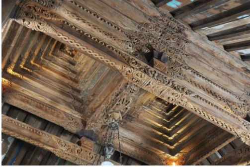
Gambar 5. Ornamen dan dekorasi menjadi bagian dari hasrat melestarikan joglo. Sebuah fantasia yang narsis dari kejayaan masa lalu yang kini mulai ditinggalkan.

setara dengan joglo masa lalu. Hasrat seseorang penting dalam perkabungan untuk mencari kehilangan ( mourning ) dan ditemukan dalam joglo raksasa tersebut (Gambar 5).