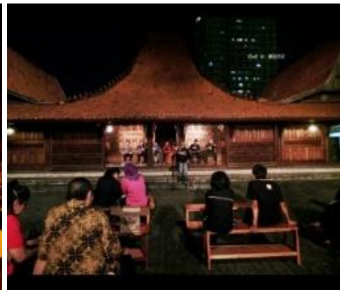
Gambar 6. Pada malam hari ruang meninggi energinya, memberikan kesenangan karena keindahan visualnya, cocok untuk aktivitas baru dengan kenangan masa lalu yang menjadi atraksi.