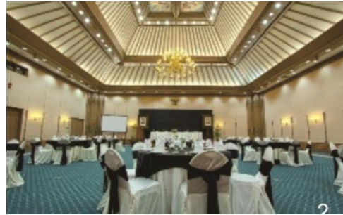
Gambar 4. Dekonstruksi menjanjikan varian baru memperoleh ruang luas dan lega, apalagi didukung oleh teknologi konstruksi sehingga ruang menjadi lega dan nyaman, serta memberikan kesenangan arsitektur.

Teknologi baru akan memungkinkan ruang dengan bentang yang lebar (konstruksi bentang lebar/ long-span ). Ruang menjadi luas, terbuka, dan lega sehingga lebih menyenangkan. Penghilangan tiang joglo karena pemakaian teknologi baru akan menjaga ruang tetap beraura joglo. Sublimasi mimesis dan eklektis menyederhanakan pakem joglo, semakin pragmatis namun efisien dalam mendatangkan kesenangan arsitektur (Gambar 4). Elemen konstruksi joglo digantikan ornamentasi.