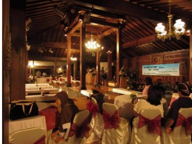
Gambar 7. Pengalaman meruang baru tidak muncul, tetap seperti masa lalu. Memori lama bertahan, abai terhadap kesadaran meruang orang sekarang.

Sumber: https://www.agoda.com/id-id/tembi-rumah-budaya-bale-2/hotel/yogyakarta-id.html?ds=CZ41JwZAoHZoWYdp , diakses Februari 2021