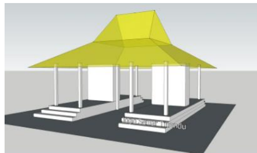
Gambar 2. Joglo Semar Tinandu sebagai rumah jaga di pintu masuk utama ( regol ), dengan saka guru yang digantikan dinding batu bata, dan juga berfungsi untuk tabir penghalang pandang.

Joglo selalu menghadirkan variannya walau seketat apapun aturannya. Arsitektur Joglo Semar Tinandu termasuk salah satu jenis joglo tanpa saka guru , karena keempat tiang tersebut digantikan konstruksi dinding batu bata, yang merupakan bukti bahwa joglo teramat fleksibel berkembang (Gambar 2). Anggapan joglo tidak boleh diubah sangat tidak beralasan, walau fungsi Joglo Semar Tinandu hanyalah sebuah regol (gerbang), bukan bangunan utama dalam kompleks rumah tinggal sehingga perubahan tersebut tidak banyak didiskusikan. Namun tetap saja hal ini merupakan bagian penting untuk mempelajari ruang dan komposisi dengan tema penggeseran ruang serta perkabungan bahwa regol pun memiliki aspek-aspek kesenangan arsitektur.